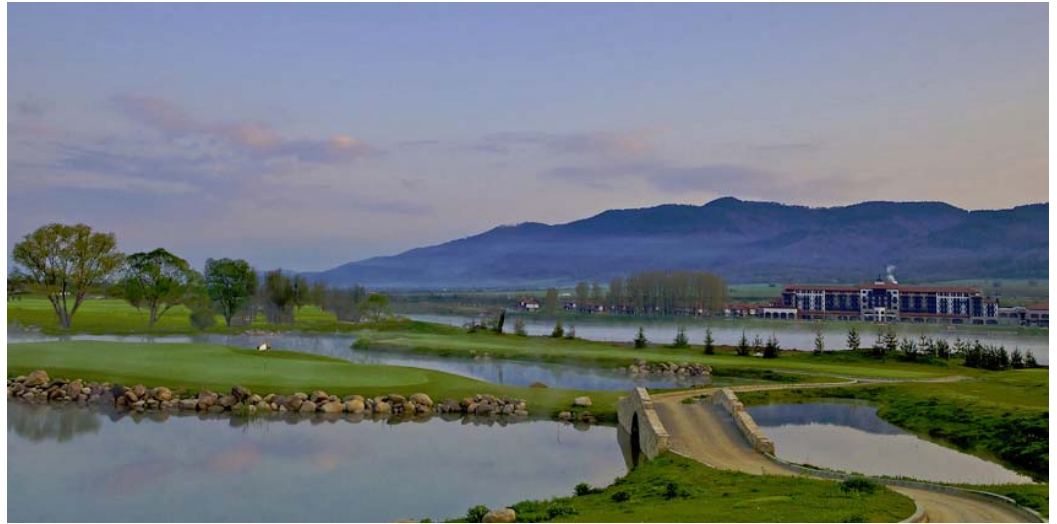
Pravets Golf & Country Club Bulgaria

П.Х.1 У меня два сына и дочь. Мой младший сын (21) учится в университете во Флориде и играет в теннис за команду университета Florida Atlantic. Моя дочь (23) работает в отельном бизнесе после окончания школы отельного бизнеса в Лозанне, а мой старший сын (26) - ландшафтный архитектор в Швейцарии. Он перестал играть в гольф из-за аварии на мотоцикле, но сейчас он начал играть опять и присоединился к компании.