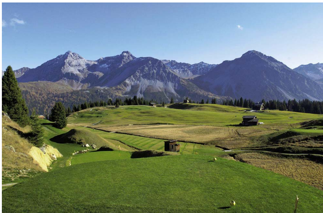
Golf Club Arosa Switzerland

К сожалению нет. Есть много частных клубов, в которых можно играть, купив грин фи, а муниципальных нет. Дело в том, что в Швейцарии демократия. Нечто подобное тому, что случилось с Дональдом Трампом в Шотландии в Швейцарии невозможно. У нас всё решается референдумом. А жители не хотят строить поля. Даже у нас гольф считают элитарным спортом. Всё дело в имидже. Его нужно менять. Число гольфистов в стране растёт, а количество полей не меняется.