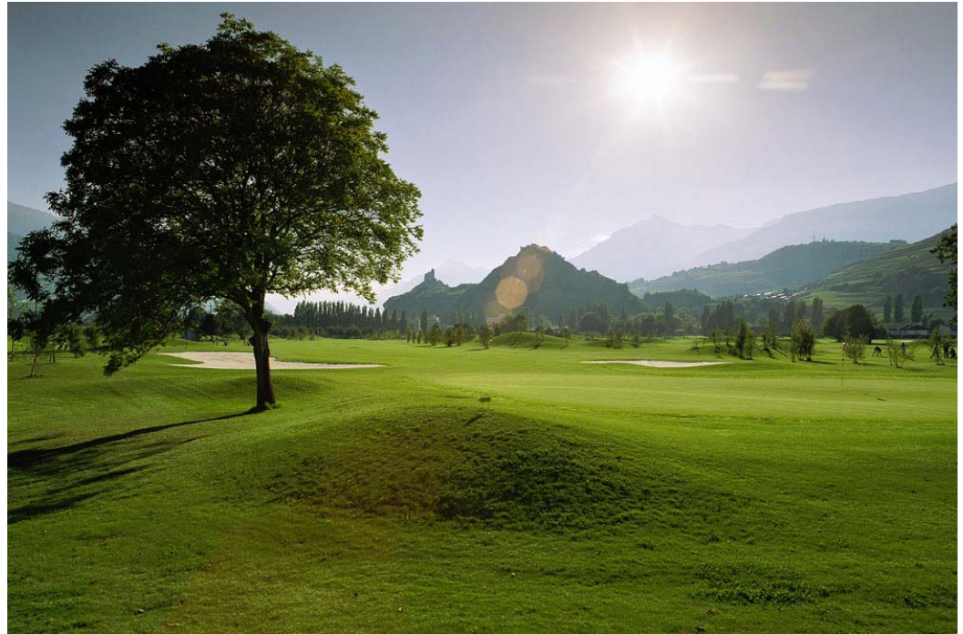
Golf Club de Stion Switzerland

Данный факт отталкивает инвесторов и энтузиастов гольфа, поэтому очень мало проектов, которые действительно строятся. В Швейцарии всего около 85 полей по сравнению с 500 полями в Швеции, поэтому у нас нет высокопрофессиональных игроков.