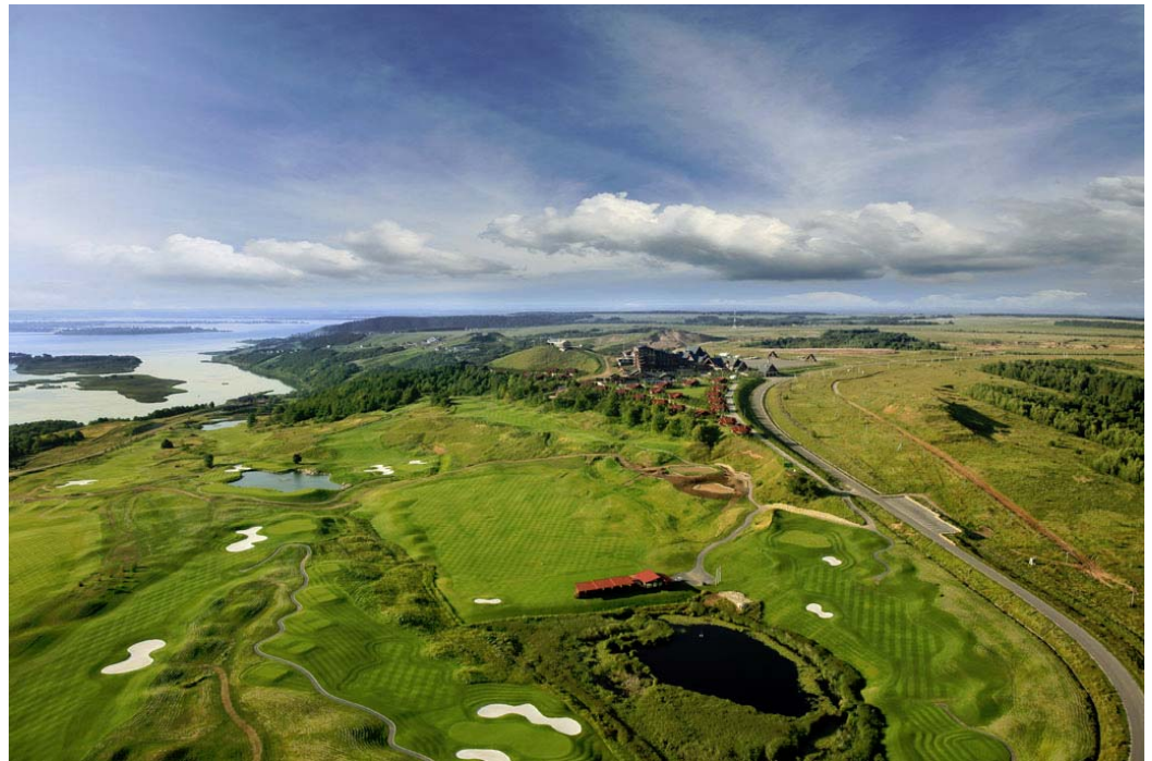
Golf & Country Club Kazan