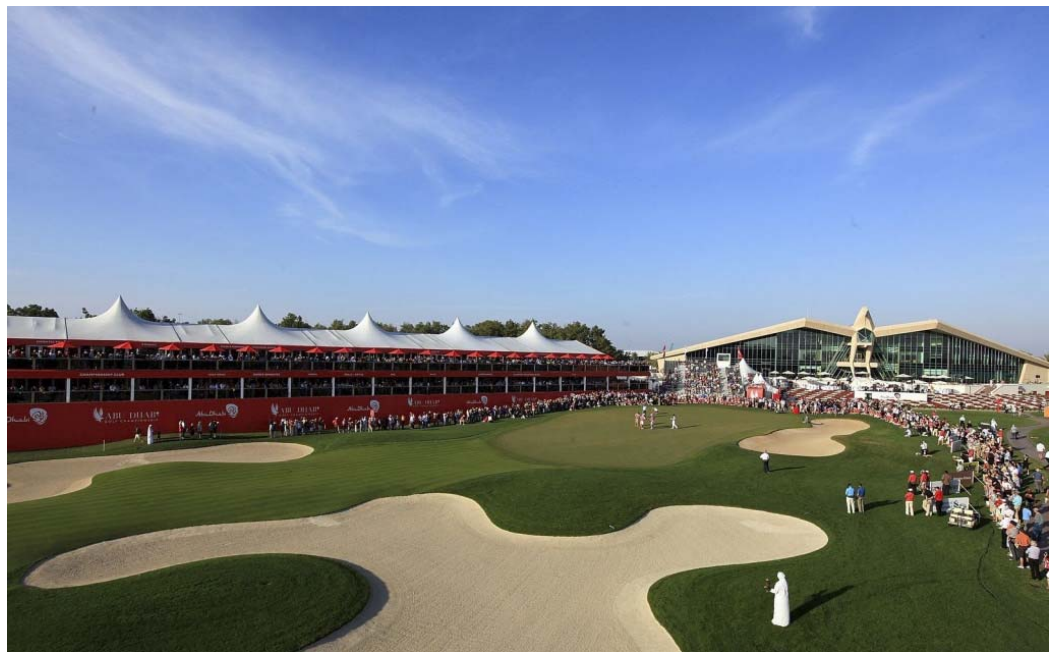
Abu Dhabi Golf Club